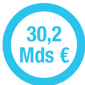
CHIFFRE D'AFFAIRES ATTENDU EN 2017

Au cours des trois dernières années, les performances du secteur de la plasturgie se sont confirmées, avec une croissance de son chiffre d'affaires de 2,8 % par an en moyenne .